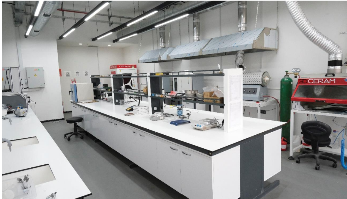
Görsel 3: Sivas Bilim ve Teknoloji Üniversitesi Metalurji ve Malzeme Mühendisliği Laboratuvarı

2547 Sayılı Yükseköğretim Kanunu ve Yükseköğretim Kurumları Bilimsel Araştırma Projeleri Hakkında Yönetmelik kapsamında; Üniversitemiz akademisyenleri ve öğrencilerinin Bilimsel Araştırma Projelerine destek faaliyetleri gerçekleştirilmektedir.