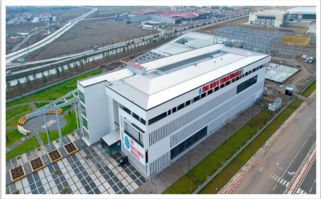
Görsel 1: Sivas Bilim ve Teknoloji Üniversitesi Kampüs Alanı Drone Çekim Görseli