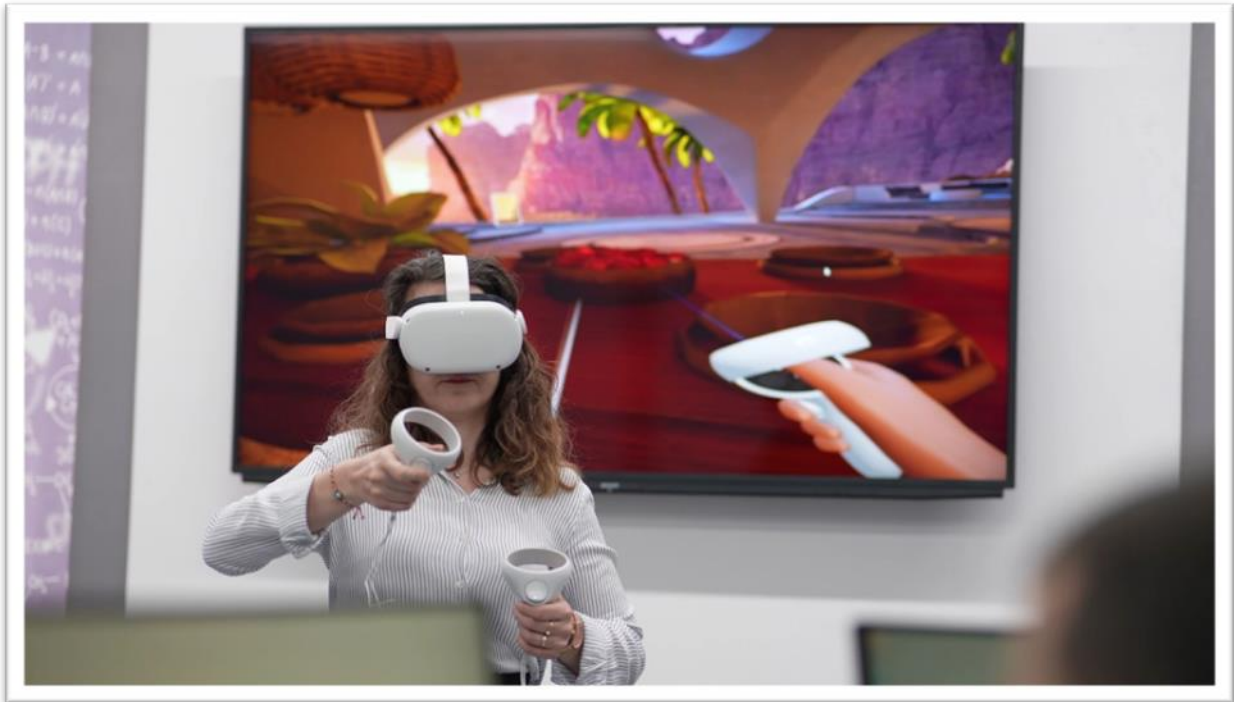
Görsel 2: Sivas Bilim ve Teknoloji Üniversitesi Metaverse ve Büyük Veri Laboratuvarı